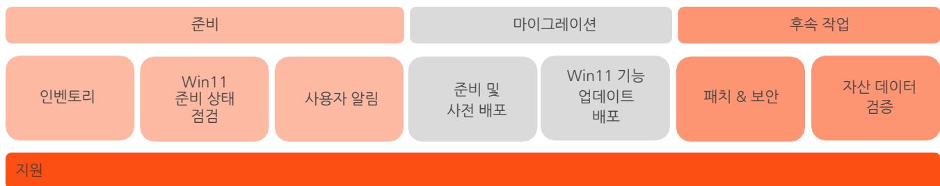
그림 1: Windows 11 마이그레이션 프레임워크

Microsoft는 개별 장치가 Windows 11의 시스템 요구 사항을 충족하는지 확인하기 위해 Hardware Readiness PowerShell 스크립트를 만들었습니다.